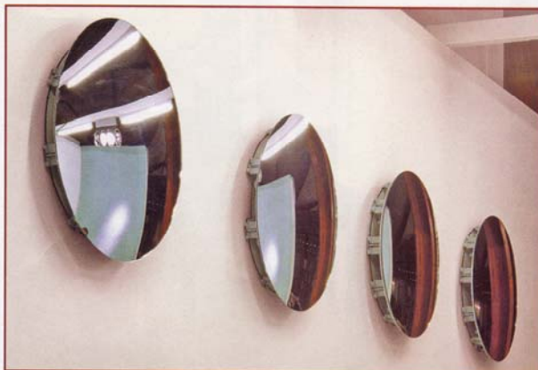
Des enjoliveurs pour la voiture ou pour le salon ? (Ann Veronica Janssens)

Du côté des plus jeunes, Freek Wambacq a travaillé autour du reflet et du sens des surfaces avec une armoire en inox poli, brillante