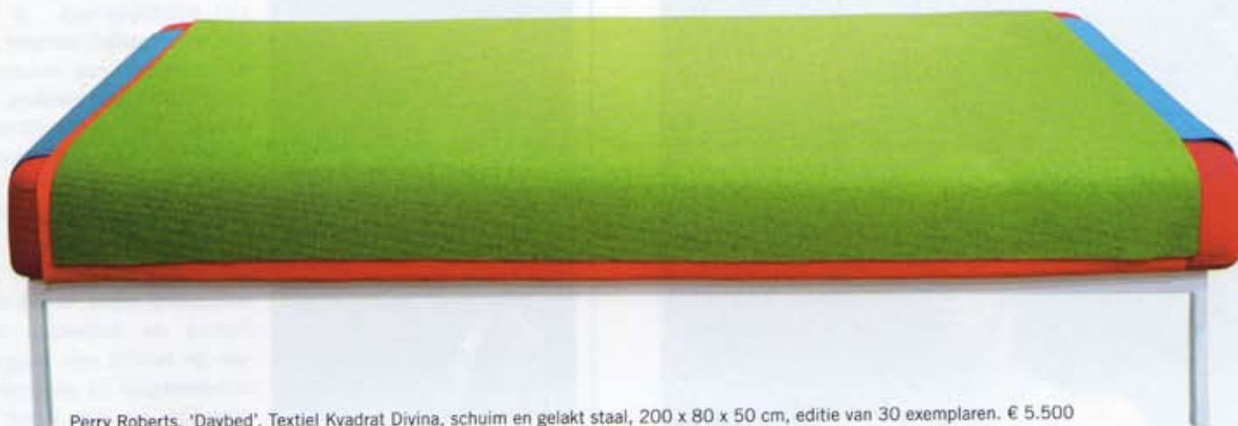
Perry Roberts, 'Daybed'. Textiel Kvadrat Divina, schuim en gelakt staal, 200 x 80 x 50 cm, editie van 30 exemplaren. € 5.500

van compromissen, maar hij is Jan Ver-cruysse. Dus maakt hij een ongelooflijk moeilijk te realiseren mes."